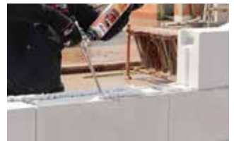
Blocs béton cellulaire